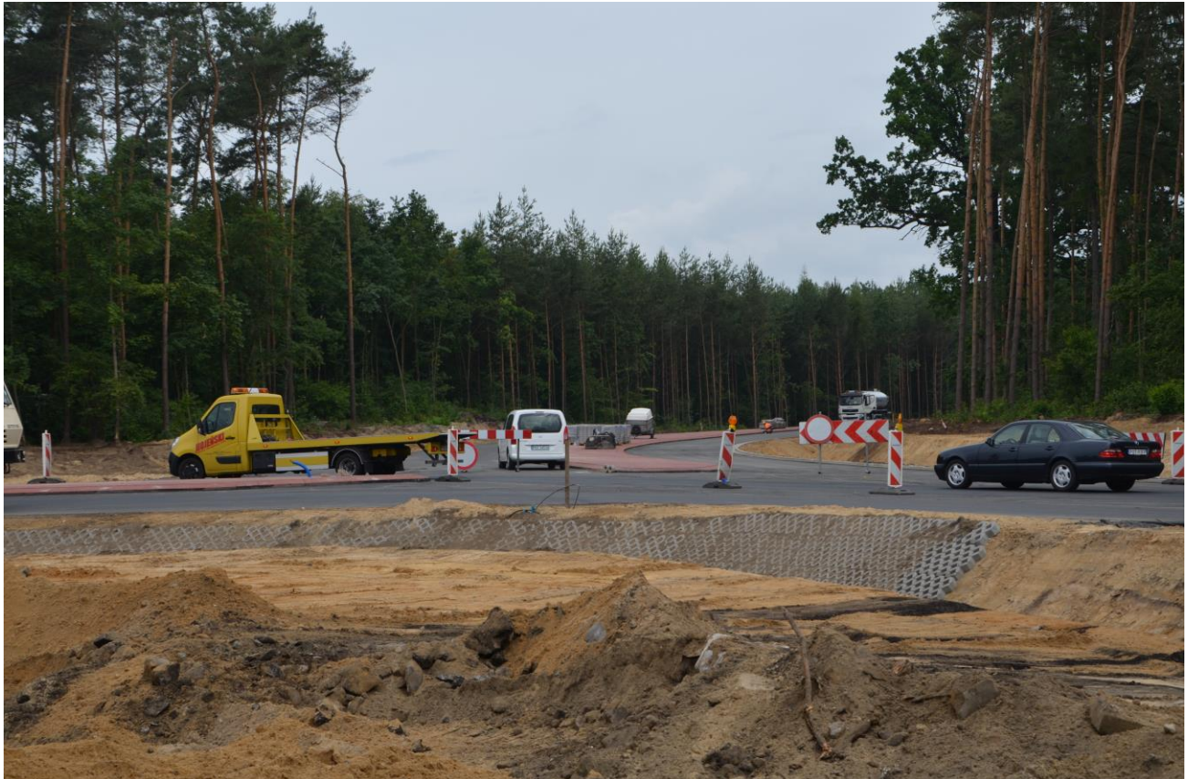
Położenie tablicy przy zjeździe z drogi ekspresowej S8

Tablica powinna zostać umieszczona przy skrzyżowaniu projektowanej drogi powiatowej z byłą drogą krajową nr 8 w gminie Bralin. Dokładne miejsce zostanie wskazane przez Zamawiającego.